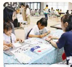
やとみ健康セミナー