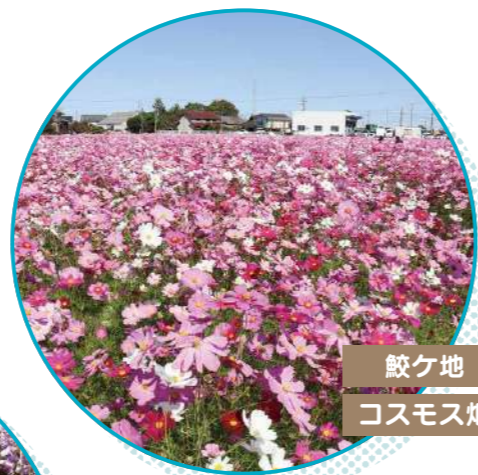
鯉ヶ地 コスモス畑