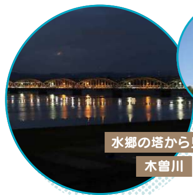
水郷の塔から見た 木曾川