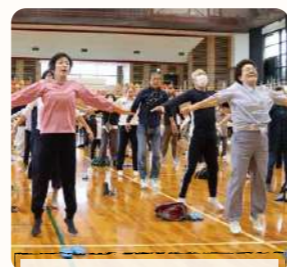
YATOMIスポーツフェスティバル