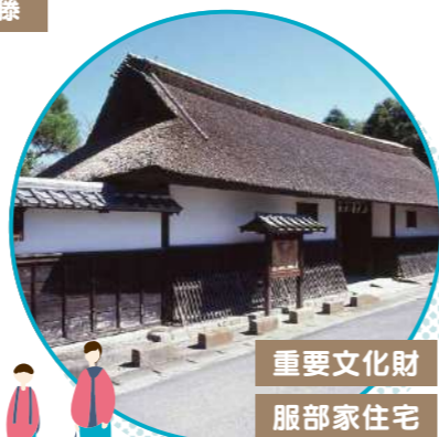
重要文化財 服部家住宅