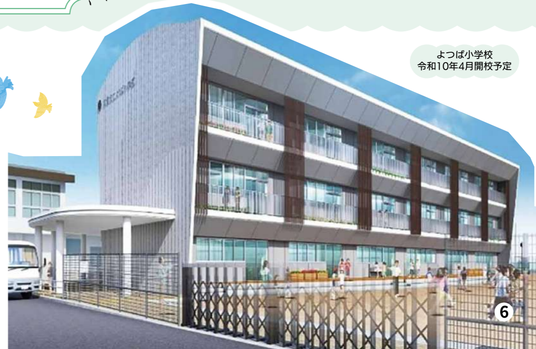
よつば小学校 令和10年4月開校予定

弥富市では、こどもたちがより充実した環境で過ごせるよう、小規模校4校の再編を進め、伸び伸びと学べる教育環境を整えています。