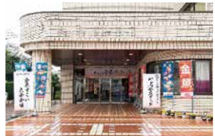
弥富市制 10 周年記念事業やとみ金魚サミット

市制施行 20 周年記念事業として、令和 8 年 10 月 3 日(「や・と・み」の語呂合わせ)に「金魚サミット」を開催します。「金魚のまち弥富」を広く PR するとともに、「弥富金魚」ブランドの振興を図ります。