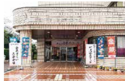
弥富市制10周年記念事業やとみ金魚サミット

市制施行20周年記念事業として、令和8年10月3日(「や・と・み」の語呂合わせ)に「金魚サミット」を開催します。「金魚のまち弥富」を広くPRするとともに、「弥富金魚」ブランドの振興を図ります。